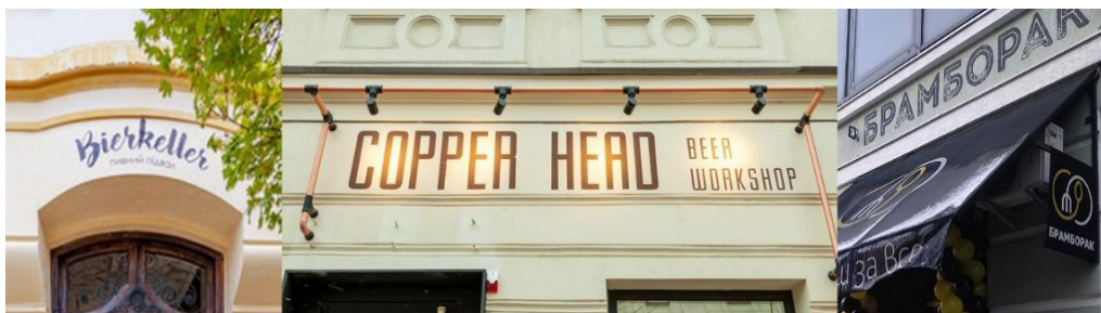
Додаток 12. Інформаційні носії Івано-Франківська виконані в техніці розпису по тиньку.