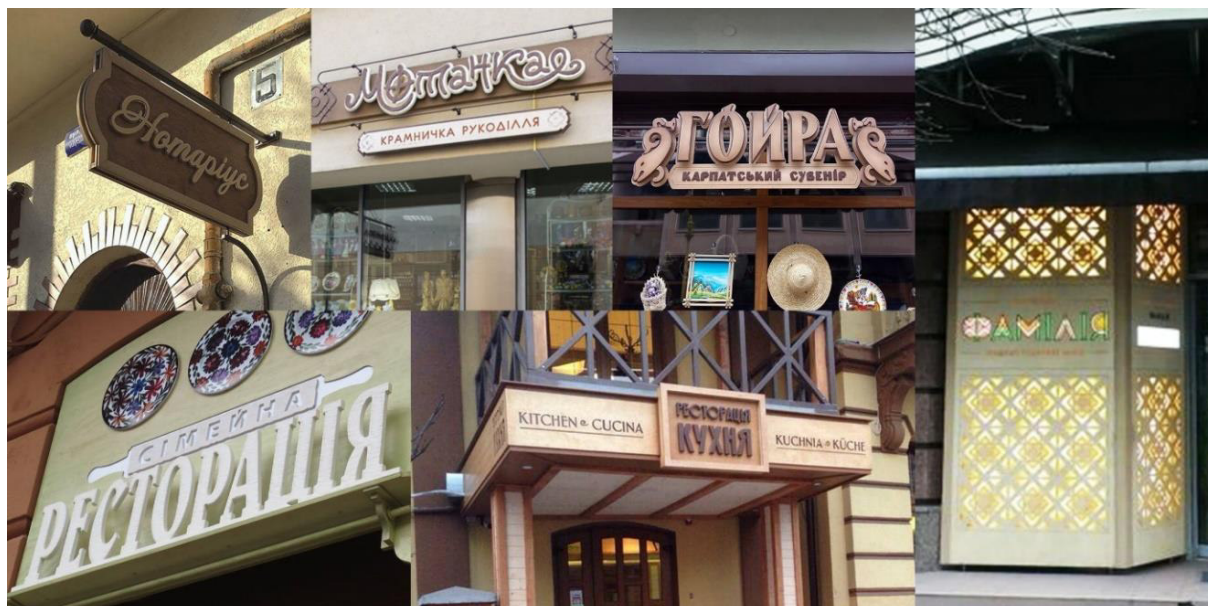
Додаток 9. Інформаційні носії Івано-Франківська виконані з використанням дерева.