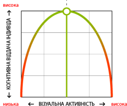
Додаток 1. Схема залежності когнітивної віддачі індивіда від рівня візуальної активності інформаційних носіїв.

оптимальний рівень візуальної активності, за якого когнітивна віддача індивіда сягає найвищого рівня