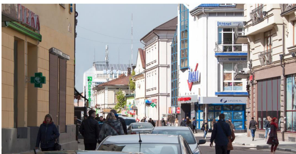
Додаток 7. м. Івано-Франківськ, вул. Галицька. 2017 рік. Фото знизу: результат редагування у графічних програмах.