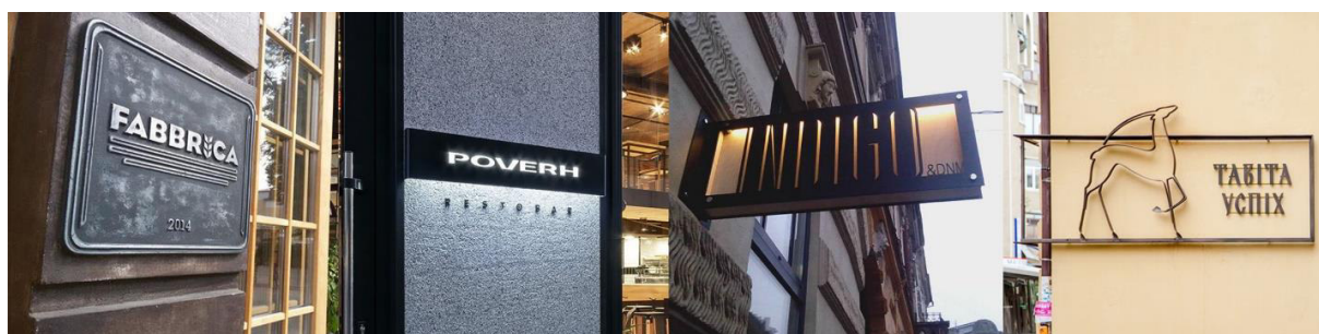
Додаток 10. Інформаційні носії Івано-Франківська виконані на металевій основі.