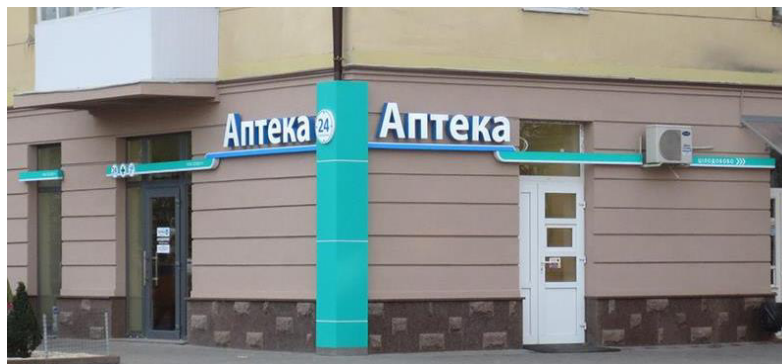
Додаток 5. Вивіска для аптеки "Іва-Фарм", м. Івано-Франківськ 2016 р. Автор: ПП "Реклама-Центр".