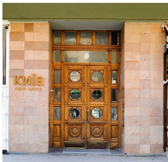
Додаток 8. Втілення проекту “Вивіски” на базі платформи “Тепле місто”. Офіс-центр “Київ”, м. Івано-Франківськ. Джерело фото: www.warm.if.ua .