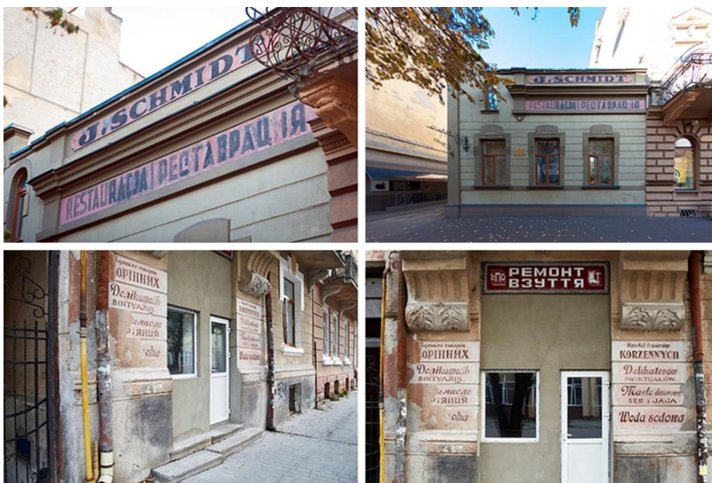
Додаток 13. Результати проекту “Дослідження та реставрація старовинних вивісок Івано-Франківська” на базі платформи “Тепле місто”. 2018 р. Джерело фото: www.warm.if.ua .

УДК 27-526.62'312.47-74:7.03(477)“16/17” DOI: https://doi.org/10.25128/2411-3271.19.2.26