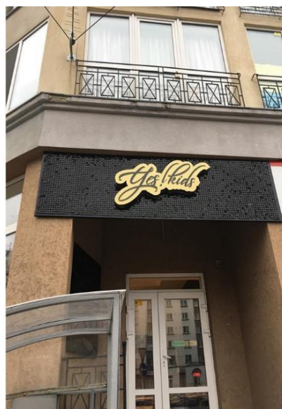
Додаток 6. Вивіски з динамічною фактурою. м. Івано-Франківськ, 2019.