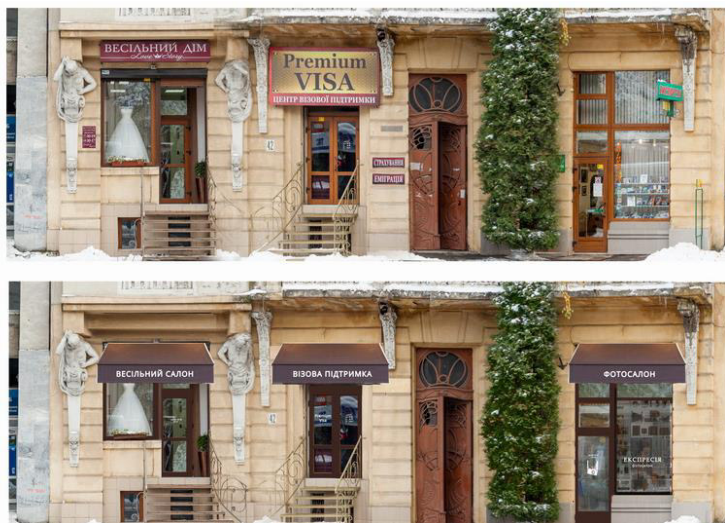
Додаток 4. Проект по організації інформаційного простору команди №2 в рамках програми "Правильні вивіски" платформи "Тепле місто". Івано-Франківськ 2016.