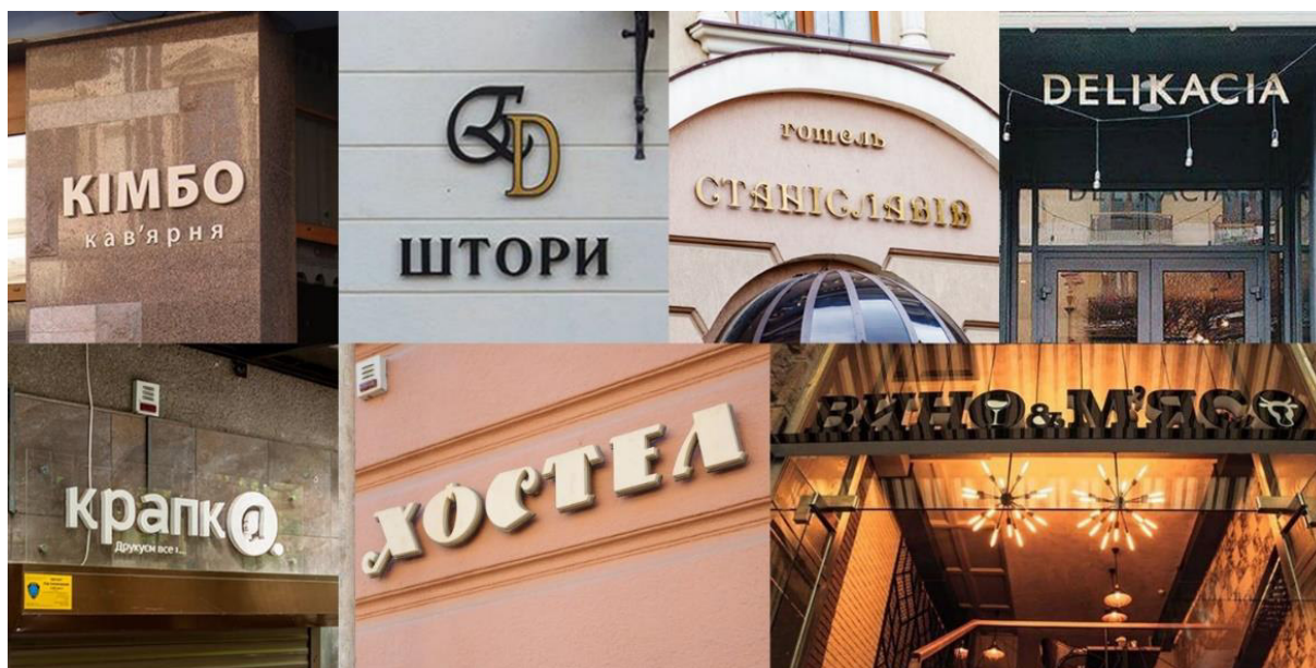
Додаток 11. Інформаційні носії Івано-Франківська виконані методом об'ємних літер.