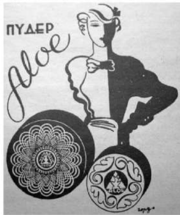
Рис. 5. Реклама української пудри “Алое” у виконанні відомого художника Святослава Гординського (“Нова Хата”, 1934)

Куди жорстокіший і лаконічніший, сповнений сили і динаміки образ, який створив А. Кассандр. Він лаконічно і, разом з тим, ефектно інтегрував у цьому плакаті текст – назву французького експреса (рис. 7).