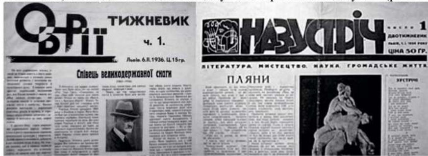
Рис. 1. Тижневик “Обрії” та двотижневик “Назустріч”.

шрифтами, часто в поєднанні з рукописними. Але і тут поширеними були акцидентні шрифти, в яких букви були зміщені, накладались одна на одну чи оберталися під кутом (рис. 1–2).