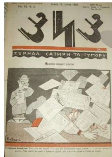
Рис. 2. Журнал “Зиз”.

Для шрифтів у дизайні упаковки характерною була оптична зміна розміру літер (опуклість, наростання чи спадання розмірів літер) (рис. 3).