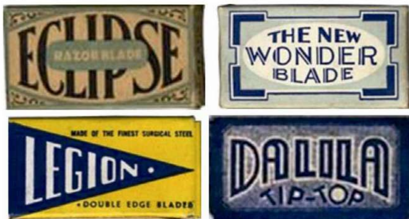
Рис. 3. Фрагмент рисунка.