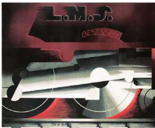
Рис. 7. Плакат. А. Кассандр. 1928 р.