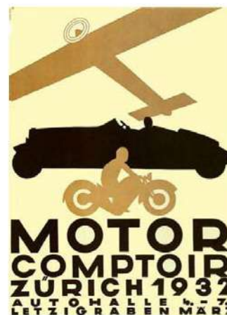
Рис. 8. Плакат. Автор Отто Баумбергер. 1932 р.