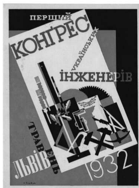
П. Ковжун. Афіша «Перший Конгрес Українських Інженерів» (1932)