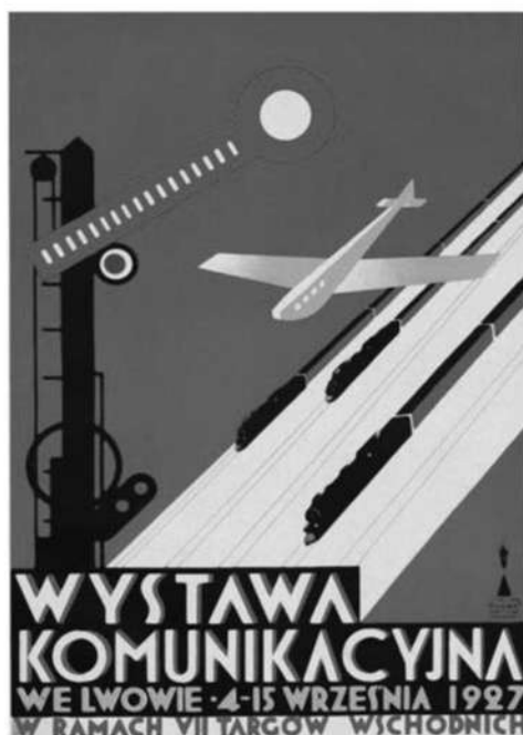
Т. Гроновський. Плакат виставки комунікації у Львові (1927)