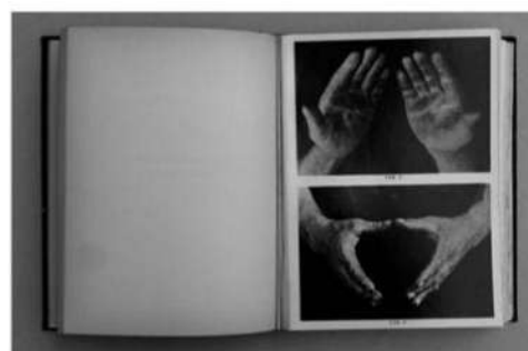
Я. Межецька. Сторінка фотоальбому «Рука, що працює» («Ręka Pracująca», 1939)