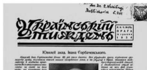
Р. Лісовський. Логотип газети «Український тиждень» (1934)