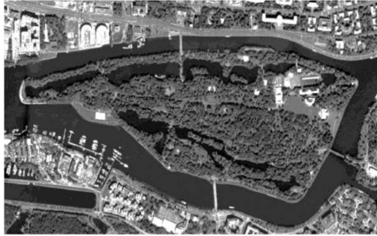
Рис. 3. Супутниковий знімок парку на Єлагіному острові.

У Санкт-Петербурзі невеличкі пагорби мають штучну природу. В Богоявленську пологі схили Вітовської балки – справжня знахідка для ландшафтного майстра. Перепад висот у Богоявленському парку становить близько 20 метрів. Найвища точка – північна частина парку. Найнижча – водойми. Висота південного пагорбу – близько 10 метрів, але схили його крутіші за північні. Завдяки пагорбам зі схилами, що спускаються з боків до центральної водойми автор досягає ефекту, коли перспектива парку поступово переходить у живописний пейзаж лиману, що відкривається тільки в певних місцях парку (так званий прийом “ах-ах”).