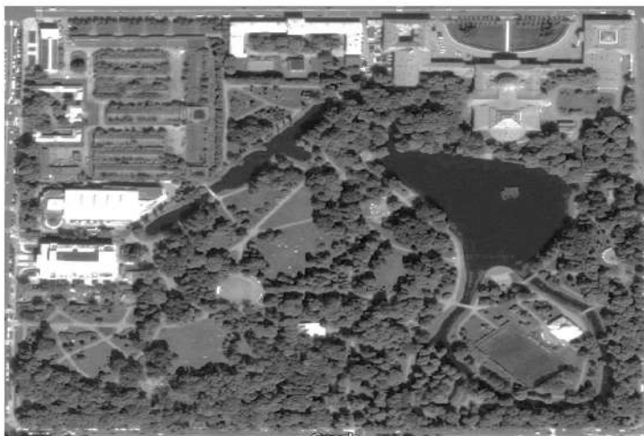
Рис. 2. Супутниковий знімок Таврійського парку в Санкт-Петербурзі.

На зображенні можна побачити, що планувальна композиція в цілому відповідає подібним паркам роботи Вільяма Гюльда, таким, як, наприклад, Таврійський сад (рис. 2) або парк на Єлагіному острові (рис. 3) у Санкт-Петербурзі (ці парки збереглися донині без суттєвих змін). У наведених прикладах палац розташований на периферії парку і є одним з кількох центрів поліцентричної композиції. Навколо палацу в усіх випадках маємо вільний простір газону. Також є широкі галявини в різних місцях парку. Вільний простір розташовано таким чином, щоб з одного боку живописний пейзаж відкривався з вікон палацу, а з іншого – щоб з деяких віддалених куточків парку було видно палац у всій красі або інші будівлі, що живописно відбиваються на поверхні водойми, створюючи локальні композиційні вузли. Самі водойми обов'язково присутні у парку. Їх площа залежала від площі парку та доступності водного ресурсу. В Санкт-Петербурзі вона