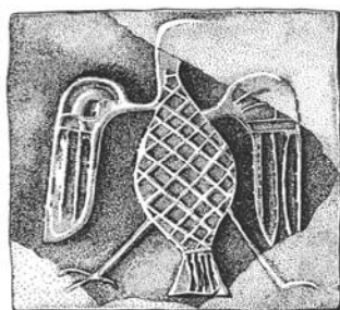
Рис. 2. Зображення орла на керамічній плитці з Василева. Івано-Франківський краєзнавчий музей (Івано-Франківськ, Україна)