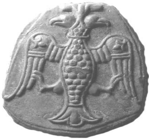
Рис. 7. Бронзова пластина з барельєфом двоголового орла розміром 68 x 50 x 6 мм 3 . Продана на аукціоні “Віоліті” 2015 р.