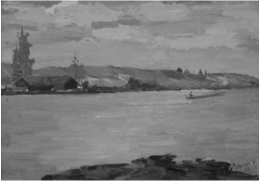
Іл. 4. Д. Шайнога. На річці (Сонячне проміння на воді). 1968 р.

Згадуючи деякі твори, які глядачі побачили вперше (їх надали колекціонери), неможливо не оцінити глибину і ширину, плановість, які охоплені полем зору художника в пейзажі (іл. 4). Відчуття рухливості у композиційній побудові, настроєвості наявні й у натюрмортах, що живуть та дихають барвами і гармонією кольорових плям (іл. 5).