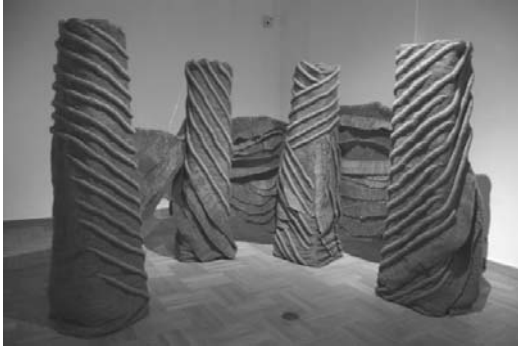
Рис. 1. Ягода Буїч