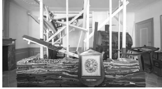
Рис. 2. Дерік Меландер

Перевагою згаданих каркасів є те, що вони не інтегровані до структури об'єктів, і це дає змогу легко демонтувати інсталяцію, компактно складати її для зберігання і транспортування. Каркаси теж можна розібрати для транспортування або виготовити нові на місці наступного експонування твору. Недолік – те, що інсталяції неможливо точно відтворити після того, як вони були розібрані, але це надає їм нової якості – при збереженні загальної композиції і форми під час наступного інсталювання може змінюватися кольорова гама та ін.