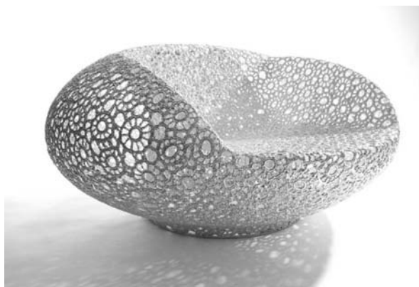
Рис. 3. Марсель Вандерс

Меблі, що розробив Марсель Вандерс (Marcel Wanders) (рис. 3), виконано за допомогою техніки в'язання з арамиду та вуглеволокна. Для надання міцності їх було натягнуто на рами чи форми й оброблено епоксидною смолою, яка після затвердіння дає змогу використовувати об'єкти за призначенням [9].